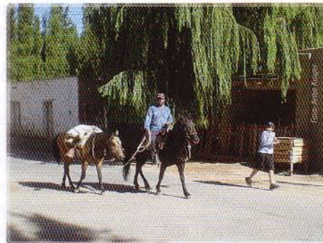
Dorfleben in Rodeo